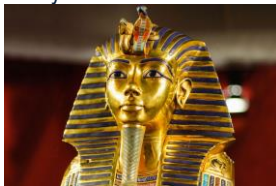
Musée des Antiquités