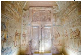
Site de Minya