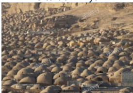
Nécropole de Minya