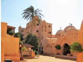
Ouadi el Natron