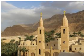
Monastère Saint Antoine