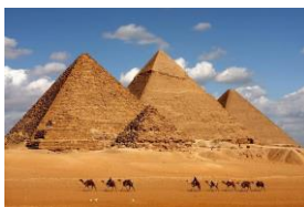
Pyramides de Ghizeh