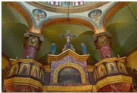
Eglise Saint Georges