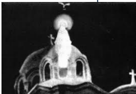
Apparition de Zeitoun