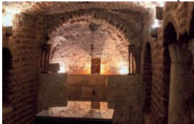
Grotte de la Sainte Famille