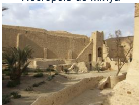
Monastère Saint Paul