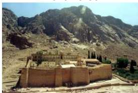
Monastère Ste Catherine