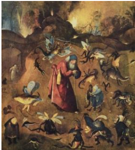
St Antoine du désert