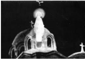
Apparition de Zeitoun