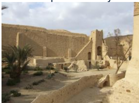
Monastère Saint Paul