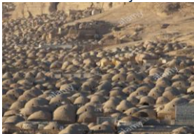
Nécropole de Minya