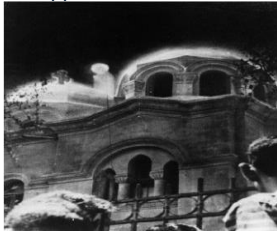
Apparition de Zeitoun