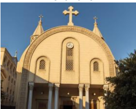
Cathédrale Saint Marc

l'une des Sept Merveilles du monde par ses proportions parfaites, Khéphren et Mykérinos , Pharaons de l'Ancien Empire). Puis tout près des pyramides, nous contemplerons le grand Sphinx de Guizèh , avec son corps de lion et sa tête humaine, l'incarnation du pouvoir royal et le protecteur des portes du temple – Déjeuner - Visite du nouveau Musée National des Antiquités, qui viendra juste d'ouvrir ses portes – Messe et rencontre dans un église copte catholique - Retour pour le repas du soir et le logement.