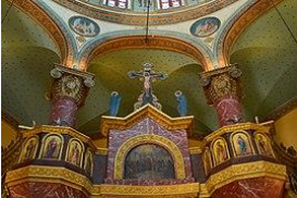
Eglise Saint Georges