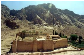
Monastère Ste Catherine