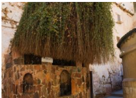
Le Buisson Ardent