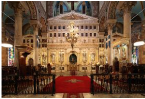
Alexandrie - Patriarcat