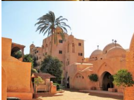
Ouadi el Natron