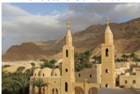
Monastère Saint Antoine