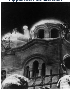
Apparition de Zeitoun

Petit déjeuner – Rencontre avec des membres du Monastère d'Anaphora pour présenter l'œuvre – Route pour Le Caire – Visite du sanctuaire N-D de l'Apparition de Zeitoun , lieu d'Apparition de la Vierge Marie entre 1968 et 1971 à des dizaines de milliers de croyants et non-croyants, reconnue par l'église Copte – Le sanctuaire est depuis le lieu de nombreuses grâces et guérisons -