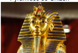
Musée des Antiquités