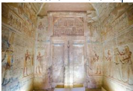
Site de Minya