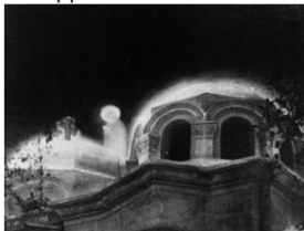
Apparition de Zeitoun

Hébergement : maison religieuse d'Anaphora