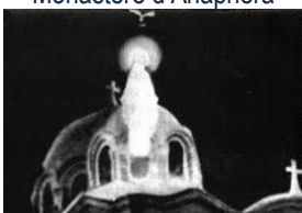
Apparition de Zeitoun

Petit déjeuner à l'hôtel puis départ pour Wadi Al-Natroun , dans la Vallée de Natroun où l'on extrait le Natron utilisé par les égyptiens dès l'antiquité pour la momification. La Sainte Famille se serait rendue dans la vallée de Natroun ; plus tard, saint Macaire le Grand qui s'y retira en 330 puis de nombreux croyants fuyants les persécutions de Byzance qui y fondèrent des églises, plus