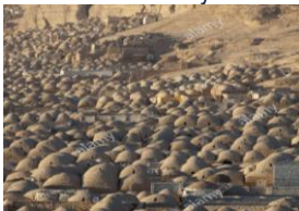
Nécropole de Minya